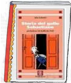
Ada Marchesini Gobetti Storia del gallo Sebastiano Ovverosia il tredicesimo uovo Fara editore

La mia storia è molto avventurosa, divertente e anche un po' complicata, perciò ve ne racconterò un pezzettino alla volta...E allora... siete pronti per ascoltare?!?