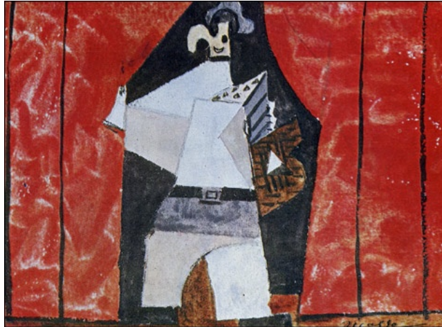
Disegno di Picasso per Pulcinella -originale-

Le sue opere più famose, oltre all' Histoire du Soldat e The Rite of Spring , sono: L'uccello di fuoco e Petruschka e Pulcinella con allestimento di Picasso (3 balletti), Ragtime , Circus Polka per 14 elefanti! Sinfonia dei salmi , la Carriera del libertino (melodramma oggi molto rappresentato nei teatri di tutto il mondo), Sinfonie e Concerti fino a The Owl and the pussycat , suo ultimo lavoro.