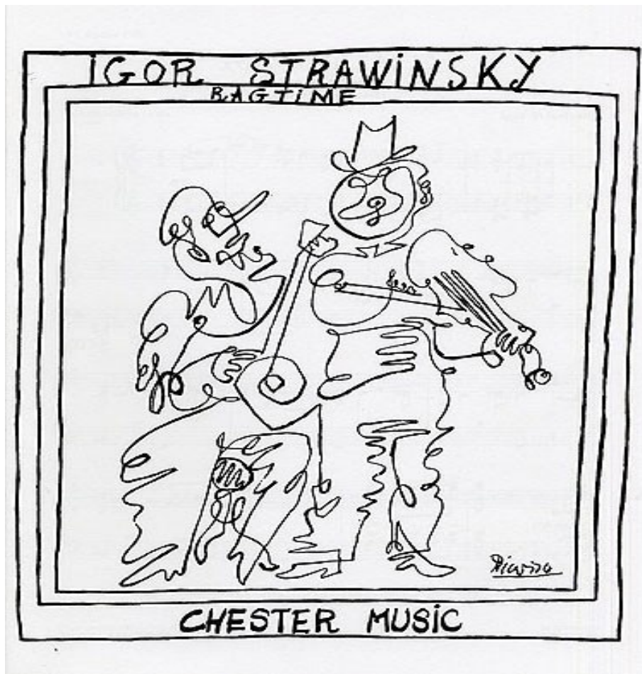
Disegno di Picasso per la copertina del Ragtime (1918)

E la sua musica? La sua musica è molto particolare e utilizza diversi linguaggi cambiando più di una volta "stile".